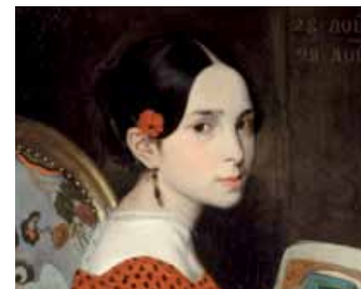
sa fille Léopoldine