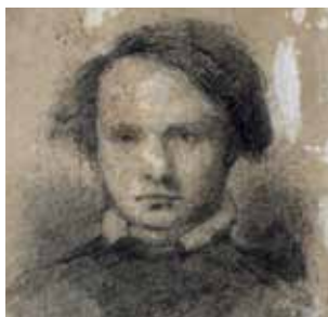
Victor Hugo enfant

Ce dessin ne fait pas partie de la salle